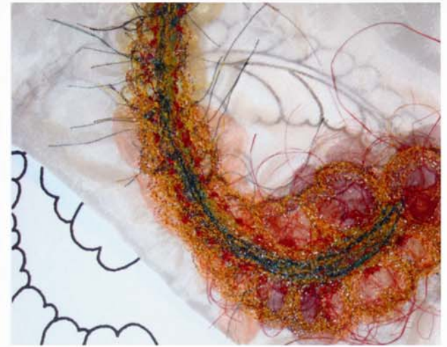
'Kameleon' (detail), 25 x 30 cm.

Voor 'Wintertooi' maakte Annelies transferprints van winterbomen op zijde. De prints legde ze op wateroplosbare folie en verbond ze door gestikte lijnen. Stikkend met de zigzagsteek over een raster van schetsmatige stiklijnen en dikke draden, ontstonden er reliëflijnen. Annelies gebruikte hierbij een borduurring en metallic machineborduurgaren.